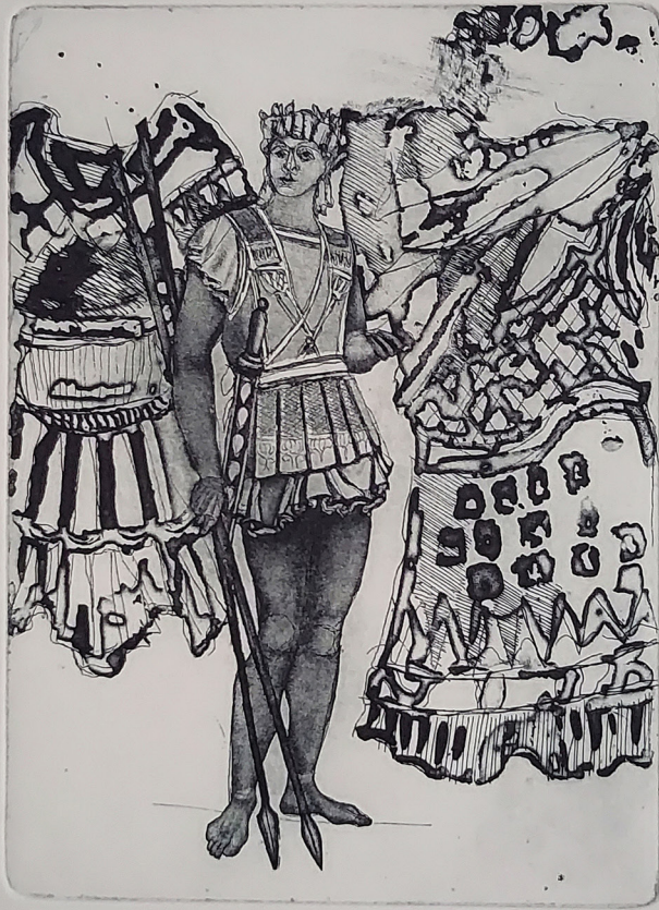
1/10 AGOSTINERTE "COMANDANTE GELISSO" POTTA LEICHERMANU/94